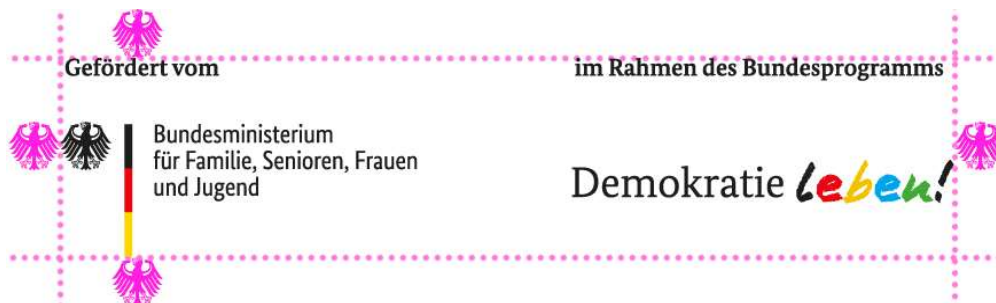
Illustration: Schutzraum um das Logo